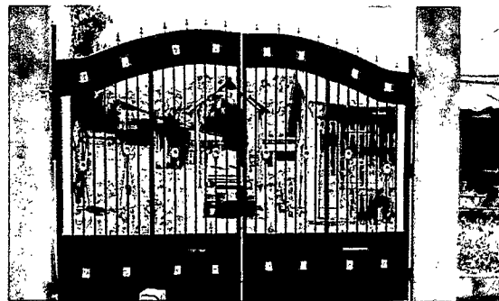
Foto 4: Se observa que ya está colocada el portón de la entrada principal del establecimiento.