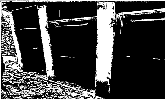
Foto 5: Se observa que las puertas del servicio sanitario ya están colocadas.