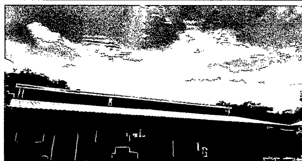
Foto 2: Se observa que ya se cambiaron las láminas oxidadas y picadas por láminas troqueladas en la parte de enfrente del aula.