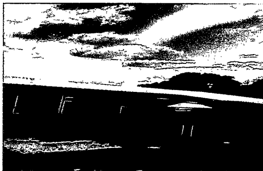
Foto 3: Se observa que ya se cambiaron las láminas oxidadas y picadas por láminas troqueladas en la parte de atrás del aula.