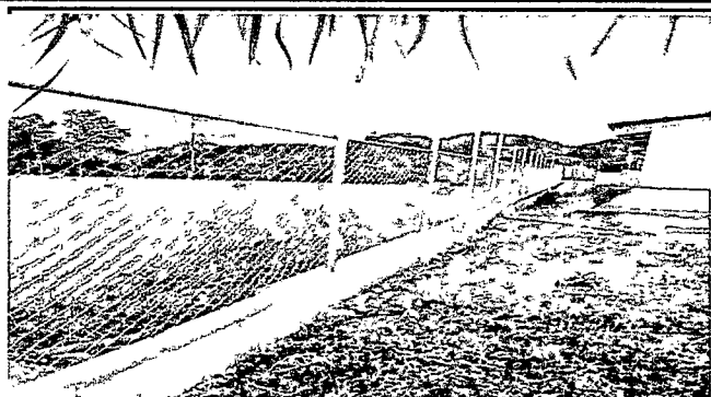
Foto 1: Se observa que las mallas y los tubos del muro perimetral ya todos están colocadas.